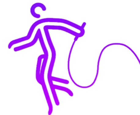
艺术体操 Rhythmic Gymnastics