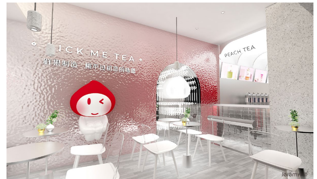
配图: 简米案列桃茗山奶茶